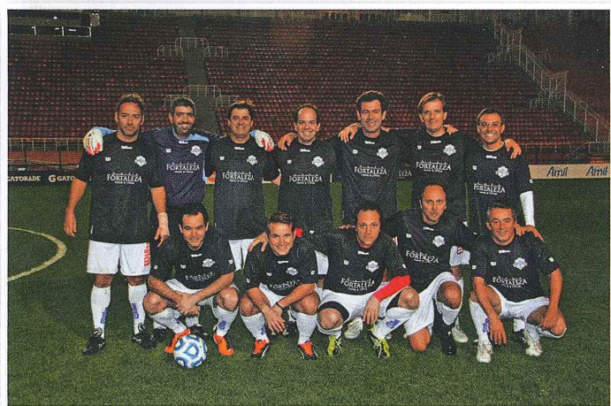
Time Casa Fortaleza