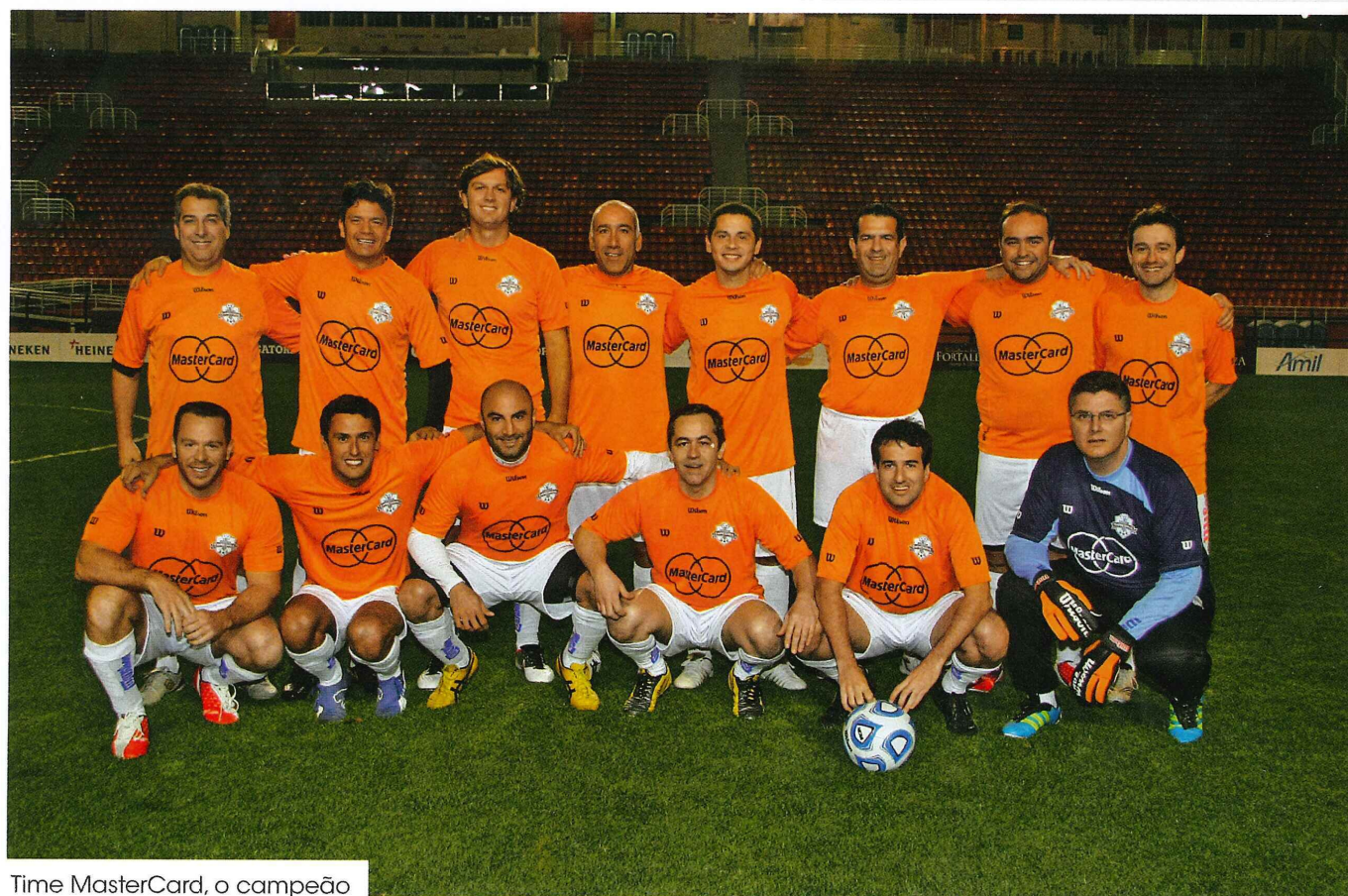
Time MasterCard, o campeão